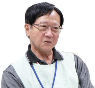
医事課ボランティア

総合医療センターは広いため、業務中はよく歩きます。私は日頃、万歩計をつけていますが、1日の業務で約5,000歩歩いています(笑)。自身の健康にも良いと思いますので、今後もボランティアを続けていきたいと思っています。