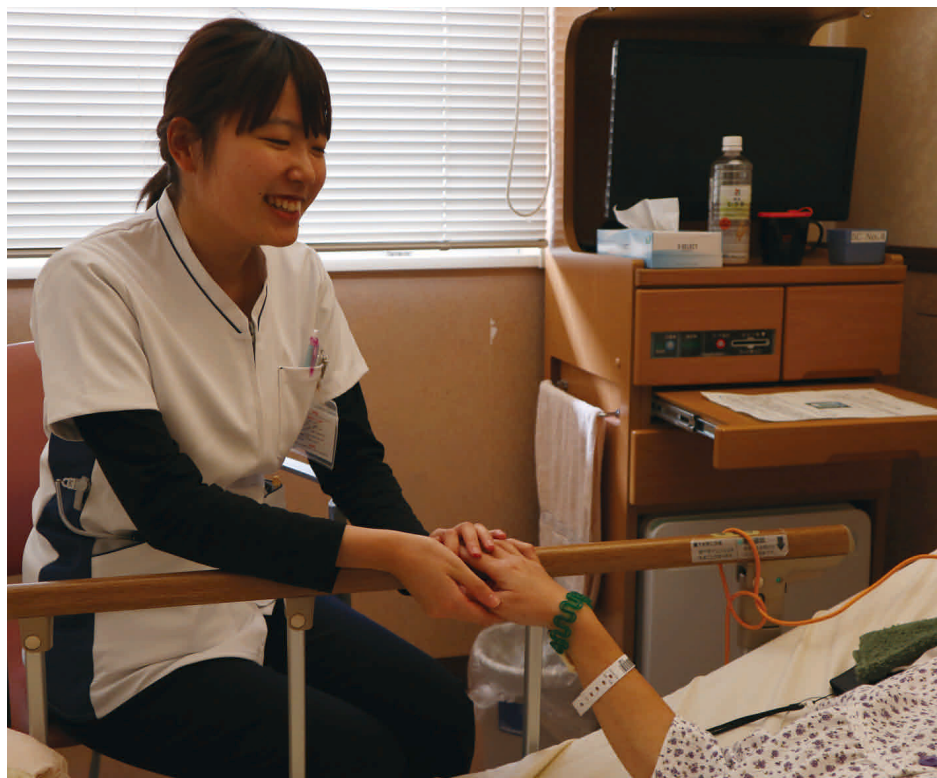
写真：看護の日 病棟の様子