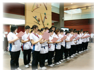
写真：看護の日 1階エントランスホールの様子