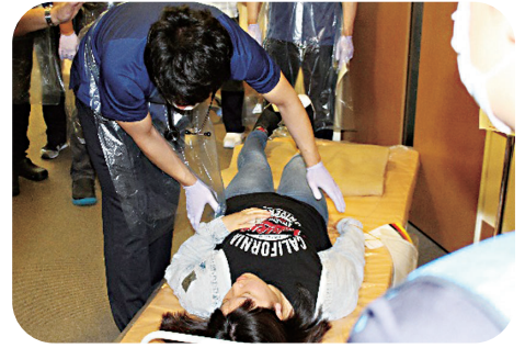
③ 診 察

訓練では当院職員だけでなく、東近江保健所、滋賀八幡病院、八幡看護専門学校など院外からも多数ご参加いただきました。ありがとうございました。