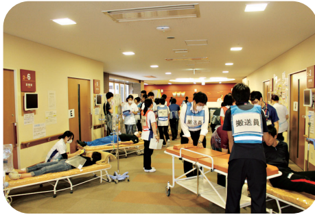
② 各エリアへの搬送