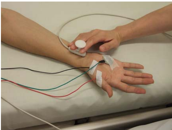
正中神経での検査