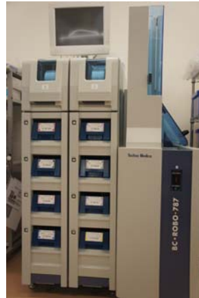
【自動採血管準備装置】

*消毒用アルコールに過敏（赤くはれるなど）な方や、採血する腕が決まっている方は採血時に申し出て下さい。